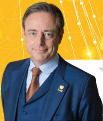
Bart De Wever Algemeen voorzitter

Engie passeert tweemaal langs de kassa. Door het uitstelgedrag van paars-groen kan het energiebedrijf extra veel geld vragen om de kerncentrales te verlengen. En daarbovenop ontvangt Engie van de regering ook nog eens gassubsidies. De belastingbetaler betaalt het gelag.